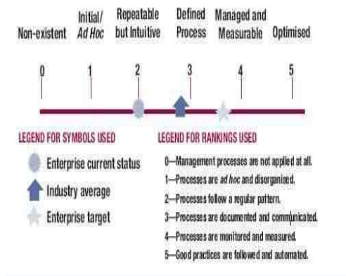
Gambar2. Grafik Representasi model skala maturity ([ITGI 2005],18)

Jika digambarkan grafik skalanya yaitu :